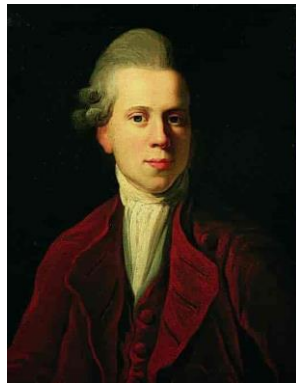
Nicolai Abildgaard, malet af Jens Juel, omkring 1768