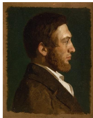
P.C. Skovgaard, malet af Lorenz Frølich i 1845