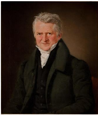
C.W. Eckersberg, malet af C.A. Jensen i 1832