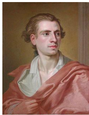
Johannes Wiedewelt malet af Peder Als i 1766