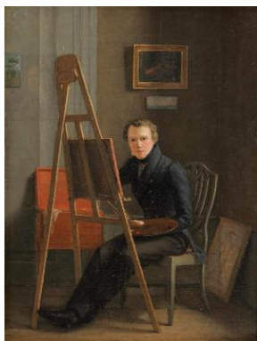
Wilhelm Marstrand malet af Christen Købke ca 1829