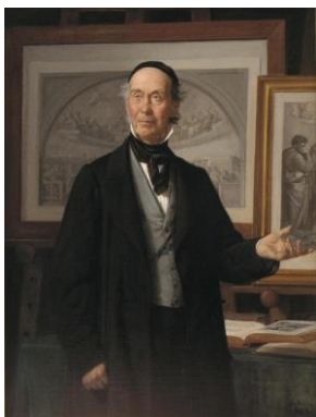
Professor N.L. Høyen malet af Wilhelm Marstrand i 1868